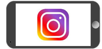
Gráfica 2 Resultado de reproducciones en Instagram.